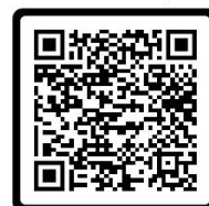
แบบยืนยันเข้าอบรม