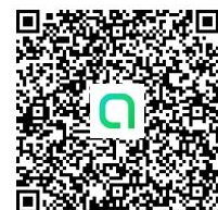
Line Open Chat